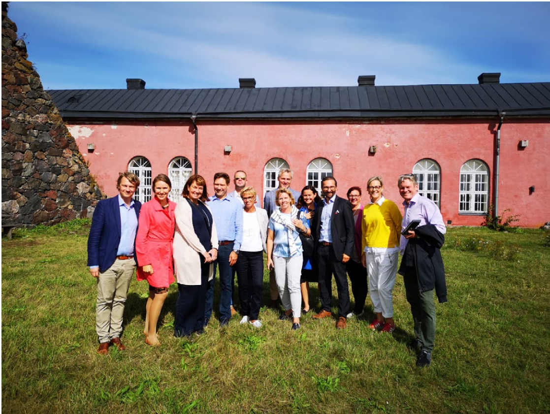
På besök på Sveaborg.